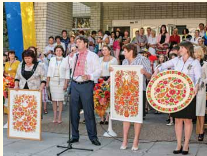
Участь Ліцею нових інформаційних технологій у підготовці проекту українського декоративно-орнаментального живопису «Петриківський розпис»