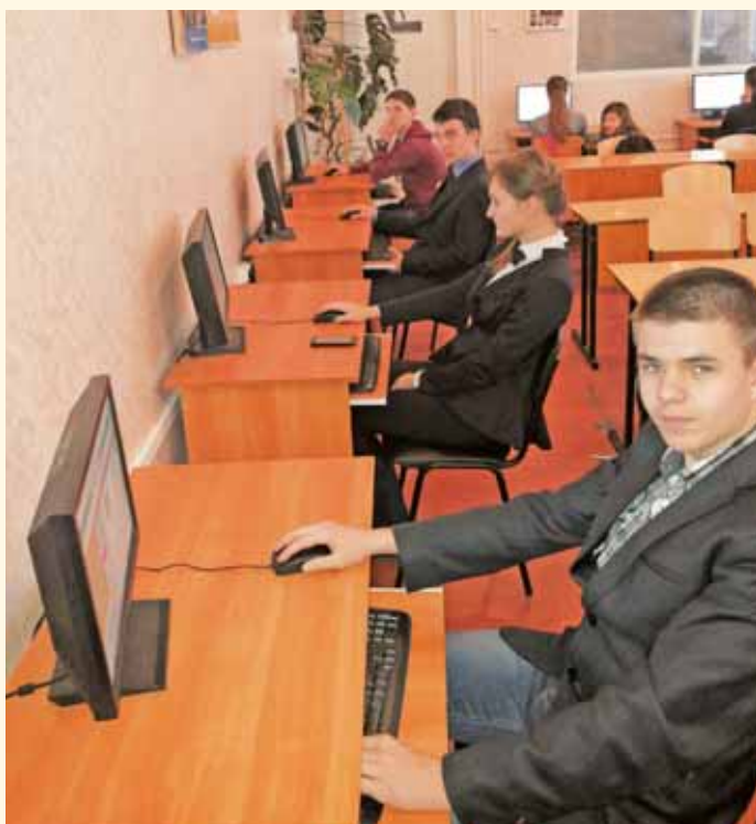
Робота над учнівськими проектами. Ліцей нових інформаційних технологій