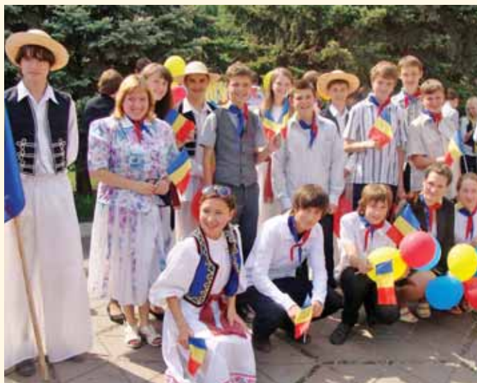
Члени ліцейського євроклубу «Ease»

планування кар'єри співпрацює з підприємствами, установами та закладами інфраструктури Дніпродзержинська, управлінням освіти і науки міської ради, центром зайнятості, вищими навчальними закладами міста та громадськими організаціями (депутатська комісія з освіти і науки, наглядова рада, рада роботодавців).