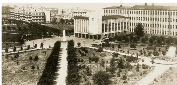
Загальний вигляд центральної частини містечка, кін. 30-х рр. XX ст.

Однак навіть беззавітний ентузіазм дітв'язів не дозволяв укластися в запланований графік робіт, основний обсяг яких