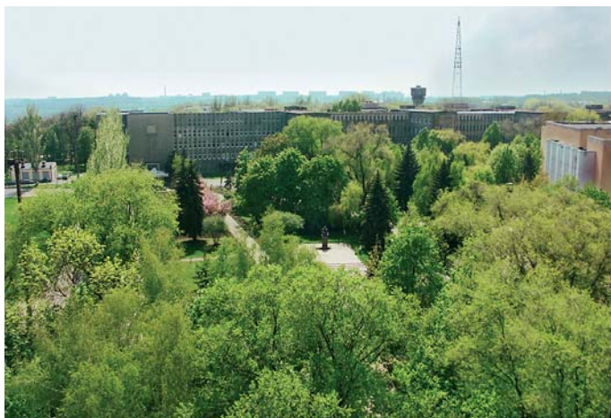
Загальний вигляд центральної частини містечка