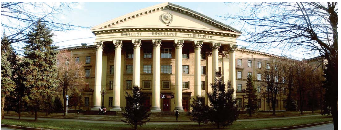
Навчальний корпус Дніпропетровського національного університету залізничного транспорту імені академіка В. Лазаряна

В інституті створені чудові побутові умови для студентів і викладачів. В окремих упорядкованих будинках живе професорсько-викладацький склад, а студенти проживають у гуртожитках. У просторі кімнати гуртожитку заселяють по чотири-п'ять осіб. У кожному блоці є загальна роздягаль-