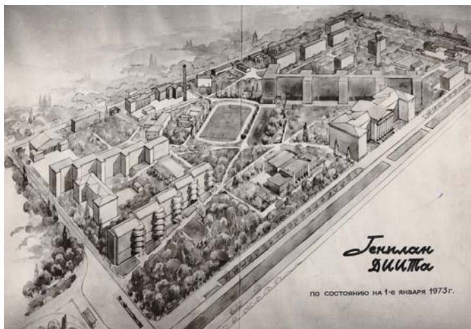
План містечка ДІТУ

ня, червоний куточок, де завжди можна знайти свіжу газету чи журнал. Для дітей відкриті яслі, дитсадок.