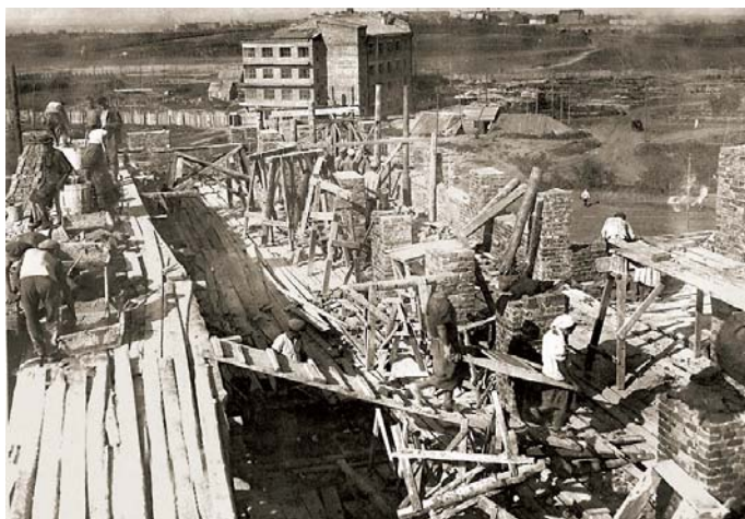
Будівництво гуртожитку, 1931 р.