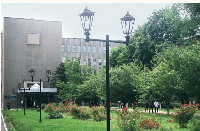
Вхід до старого навчального корпусу