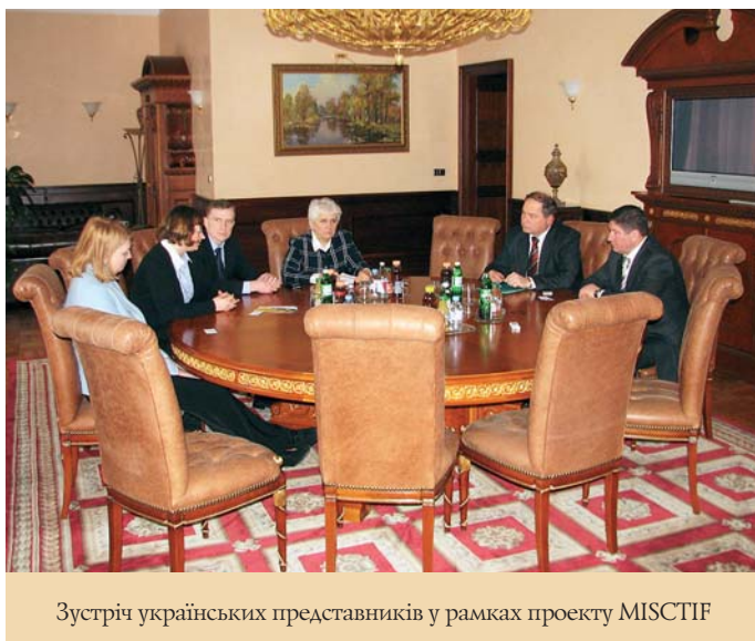
Зустріч українських представників у рамках проекту MISCTIP

14 липня 2013 р. університет відвідала делегація Департаменту вищої освіти провінції Гансу (Китай), до складу якої ввійшли директор підрозділу міжнародного співробітництва та обміну Департаменту вищої освіти провінції Гансу, ректори Політехнічного університету та Ланьчжоуського університету транспорту. Результатом переговорів стала домовленість щодо співпраці в галузі науково-академічного обміну студентами, викладачами, спільні наукові розробки та інше.