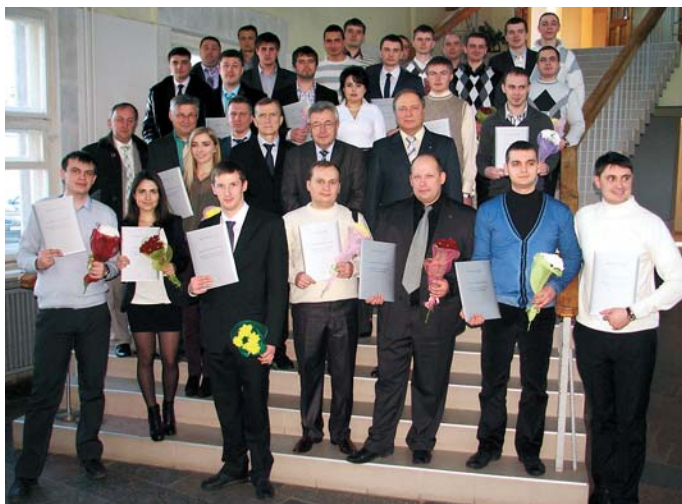
Вручення дипломів Національної школи майстерності та професій (Спат, Франція) за спеціальністю «Інтероперабельність та безпека на залізничному транспорті»