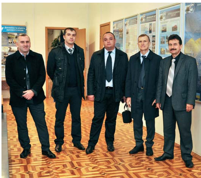
Зустріч із представниками адміністрації м. Зугдіді, Грузія