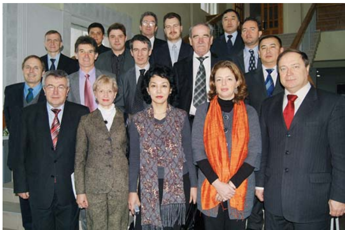
Перша зустріч Консорціуму Спільного європейського проекту MISCTIF у ДНУЗТ

20 жовтня 2012 р. ДІТ взяв участь у Всесвітній виставці «Експо-Китай-Освіта-2012» у Пекіні.