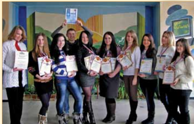
Переможці конкурсу студентських наукових робіт

2010 рік — на 38 кафедрах працюють 643 штатні науково-педагогічні працівники і 139 сумісників. Серед них семеро заслужених діячів науки і техніки України, 11 лауреатів Державної премії України в галузі науки і техніки, двоє заслужених працівників освіти України,