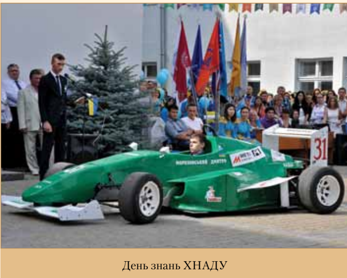
День знань ХНАДУ

2011 рік — за значні досягнення у галузі науки, вагомий внесок у вирішення науково-технічних та соціально-економічних проблем Харківського регіону університет відзначено Почесною грамотою Державного агентства з питань науки, інновацій та інформатизації України.