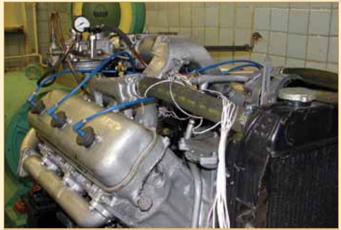
Модель газового двигуна

2003–2004 навчальний рік — на кафедрі будівництва та експлуатації автомобільних доріг створено мобільну пересувну лабораторію на базі автомобіля ГАЗель, за допомогою якої виконано великий обсяг робіт щодо ви-