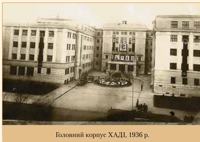
Головний корпус ХАДІ, 1936 р.

1934–1935 навчальний рік — завершено будівництво двох студентських гуртожитків загальною площею 2900 м 2 .