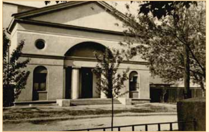
Новий спортзал, 50-ті рр. XX ст.

1935 рік — організовано перший випуск збірників наукових праць ХАШІ — «Праці Харківського автодорожнього інституту». До збірника увійшло десять статей провідних фахівців інституту.