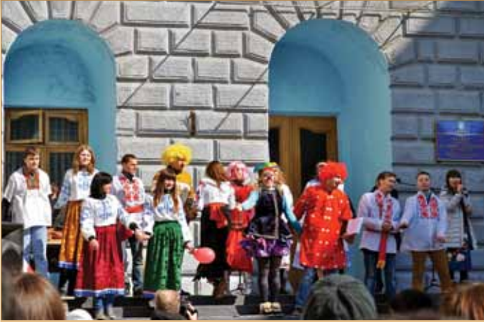
Свято Масляної на День відкритих дверей в ХНАДУ

2010–2011 навчальний рік — після капітальної реконструкції (вартістю 8 млн грн) введено в дію гуртожиток по вул. Р. Ейдемана, 13-А, де нині проживають 18 сімей викладачів, аспірантів і співробітників університету та 60 студентів.