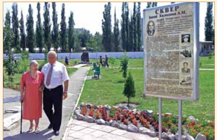
У сквері А. М. Холодова