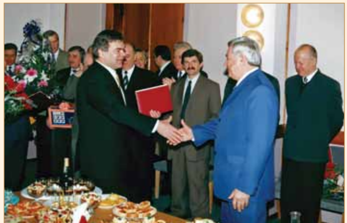
Міністр МОН України В. Г. Кремень вітає ректора Анатолія Туренка з ювілеєм

2005 рік (березень) — колектив кафедри будівництва та експлуатації автомобільних доріг здійснив обсте-