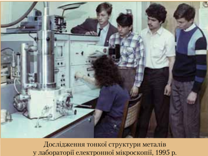
Дослідження тонкої структури металів у лабораторії електронної мікроскопії, 1995 р.

1993 рік (6 липня) — на базі кафедр економіки і організації автомобільного транспорту та економіки і управління в дорожньому господарстві створено кафедри менеджменту та економіки і організації виробництва.