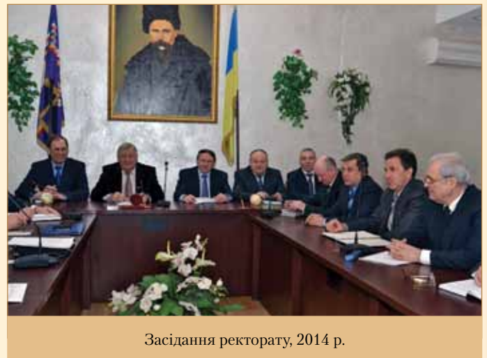
Засідання ректорату, 2014 р.

2014 рік (11 березня) — до 200-ї річниці від дня народження Т. Г. Шевченка кафедрою українознавства спільно з Національним аерокосмічним університетом «ХАІ» проведено міжуніверситетський семінар на тему «Знакова роль Т. Г. Шевченка в утвердженні українознавства». До співпраці були залучені Центр українських студій ім. Д. І. Багалія та Східний інститут українознавства ім. Ковальських. Під час проведення семінару було заслухано та обговорено понад 30 робіт та доповідей викладачів харківських вишів.