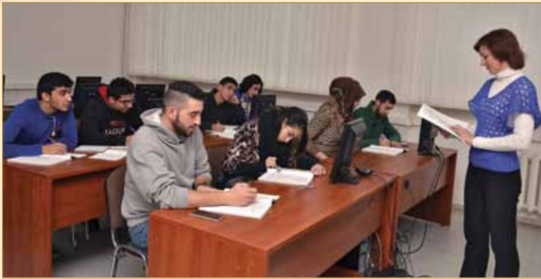
Заняття з біології

освіти, отриманої іноземцями на батьківщині, доведення їх до рівня вимог середньої освіти України).