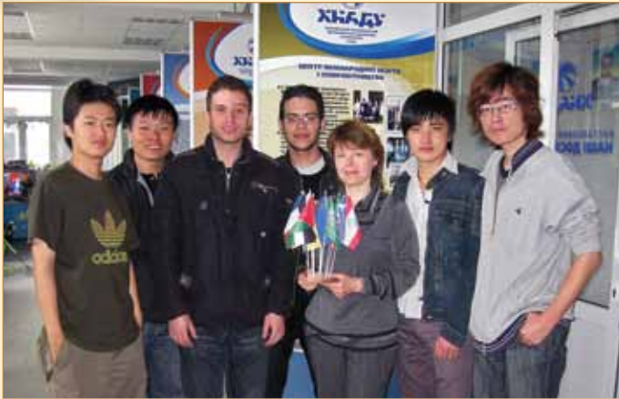
Експерсія до виставкового комплексу ХНАДУ в межах профорієнтаційної роботи

здійснюється розробка масштабного курсу дистанційного навчання, який охоплює всю програму з російської мови як іноземної для студентів підготовчого відділення. Адже в умовах глобалізованого мультинаціонального та мультикультурного простору дистанційний варіант отримання освіти набуває все більшої популярності.