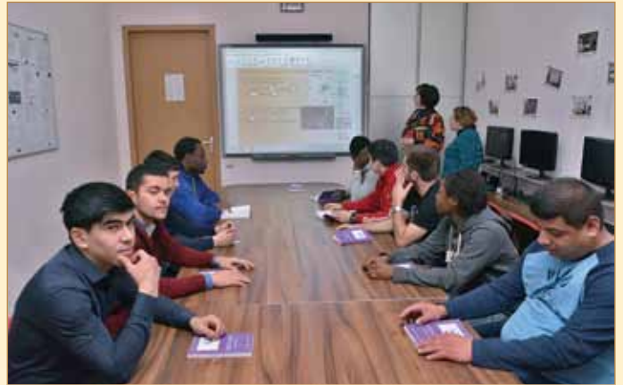
Під час занять із використанням SMART-BOARD

міжуніверситетських конкурсах, де вони здобували призові місця.