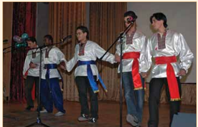
Студенти-іноземці долучаються до української культури

Науково-технічний прогрес й інші, в тому числі політико-економічні чинники, зумовлюють постійну потребу в створенні нових матеріалів, які б чутливо реагували на зміни в суспільстві, в менталітеті студентів, а також на нові умови навчання. Тому сьогодні викладачами кафедри