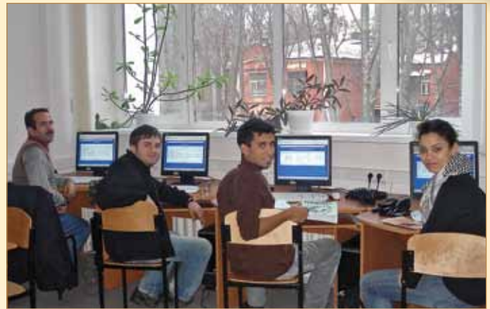
У комп'ютерному класі до послуг іноземних студентів найновіші комп'ютерні програми та авторські комплекси

Застосування у навчальному процесі навчальних мультимедійних програм дає низку переваг: можливість комбінування різних форм подання інформації (текстової, графічної, анімації, аудіо, відео); використання різних завдань «навчання на власному досвіді»; можли-