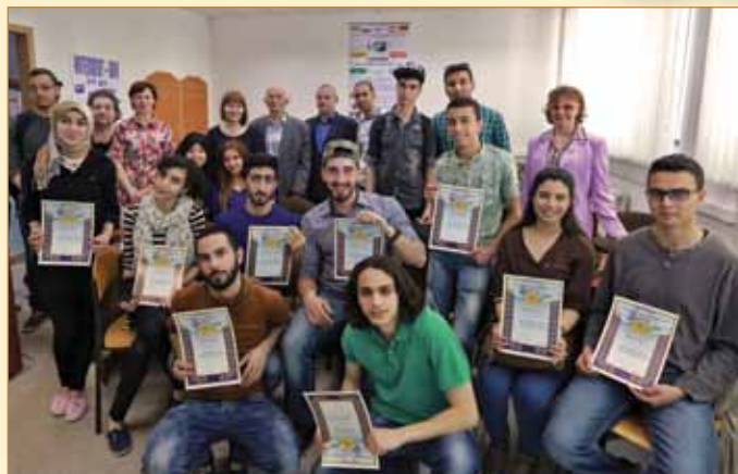
Дипломанти студентської конференції