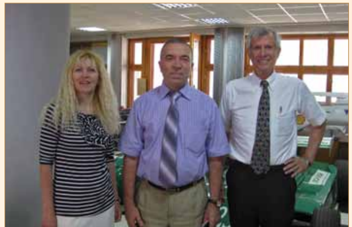
Лабораторію швидкісних автомобілів ХНАДУ відвідав професор Принстонського університету Річард Майлз (США)