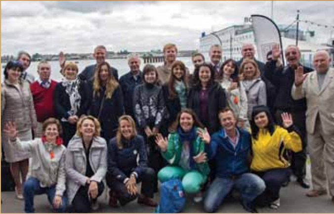
Фото на згадку після координаційного засідання учасників європейського проекту TEMPUS-EANET (Нідерланди)