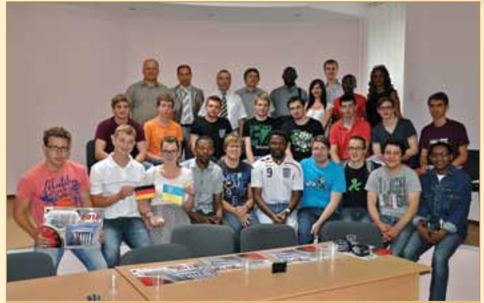
Упродовж п'яти років поспіль до ХНАДУ приїжджають студенти з технічного університету м. Аахена (Німеччина)

Об'єктивним визнанням здобутків університету на міжнародному рівні є вибір іноземними студентами,