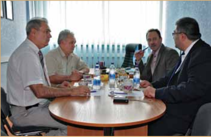
Перемовини керівництва факультету комп'ютерних технологій і мехатроніки з представниками Міністерства транспорту Сирії