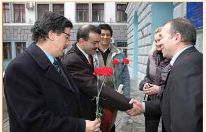
Зустріч у ХНАДУ Надзвичайного і Повноважного Посла Алжирської Народної Демократичної Республіки в Україні