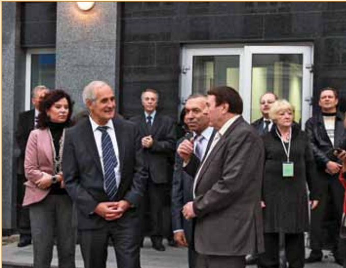
Яскравий захід «Ніч науки в ХНАДУ» відвідав Генеральний консул Німеччини в Україні пан Детлеф Вольтер