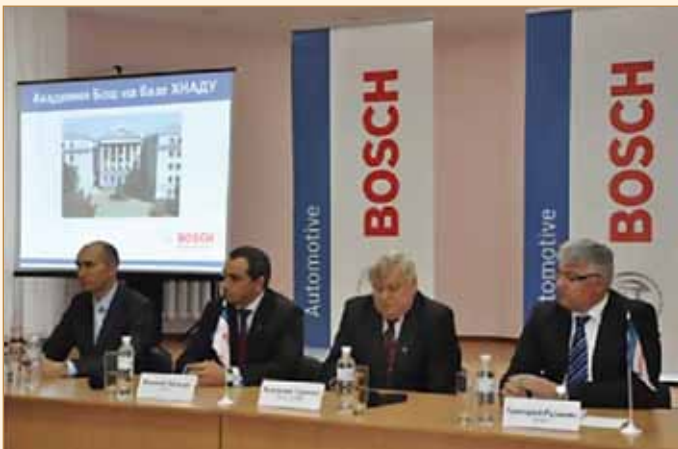
Уроцисте засідання, присвячене відкриттю Академії BOSCH на кафедрі технічної експлуатації і сервісу автомобілів ХНАДУ