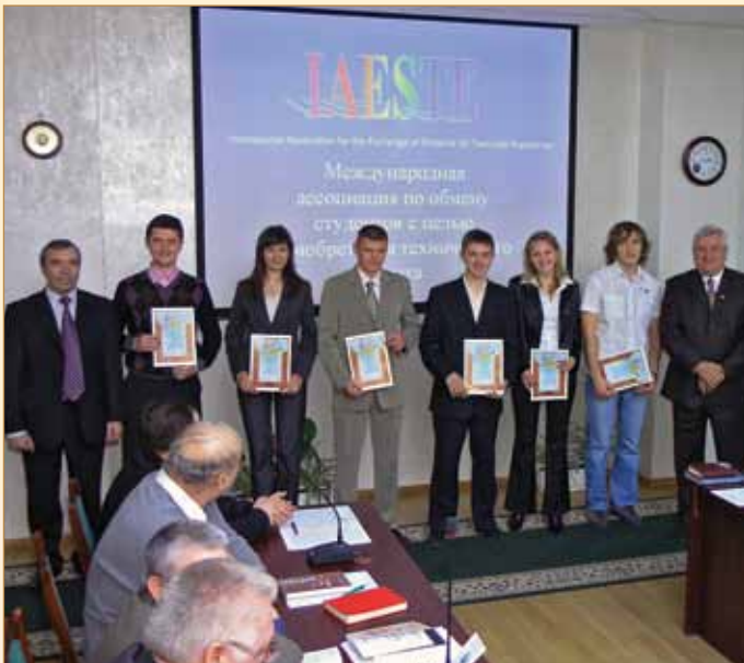
Студенти ХНАДУ – учасники міжнародної програми IAESTE – звітують членам вченої ради університету про своє закордонне стажування