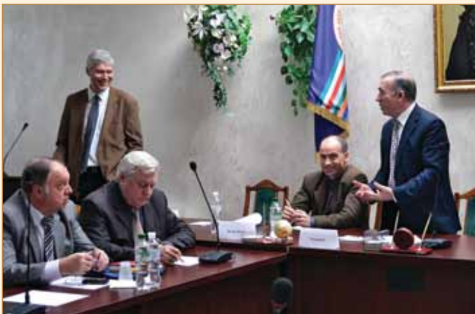
Професор Томас Фішер (Німеччина) під час презентації науково-дослідницької лабораторії з проблем екології Бранденбурзького технічного університету (м. Котбус)

Активно, давно і плідно ХНАДУ співпрацює зі своїми російськими партнерами, головними серед яких є