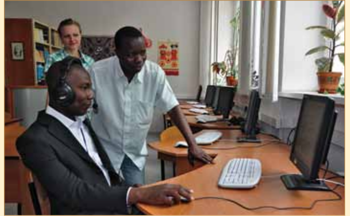
Навіть Почесному Консулу Гвінеї стало цікаво скористатися сучасними технологіями мовної підготовки, впровадженими на підготовчому відділенні ФППГ