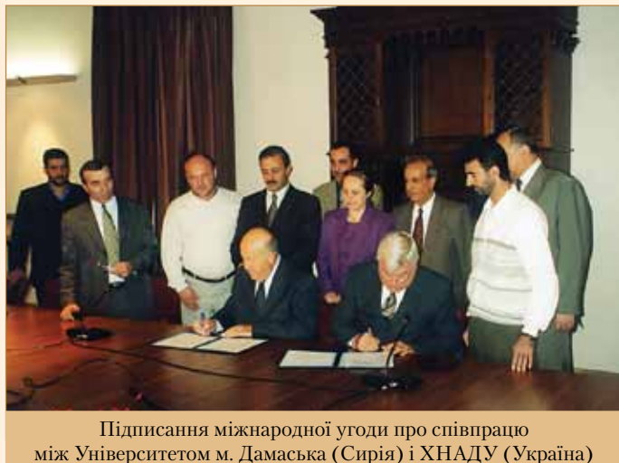
Підписання міжнародної угоди про співпрацю між Університетом м. Дамаська (Сирія) і ХНАДУ (Україна)

Вагомим внеском у підвищення міжнародного рейтингу ХНАДУ є численні міжнародні індивідуальні гранти співробітників університету, що роблять можливим (за кошти Європи і США) їх навчання та проходження наукового і професійного стажування у провідних ВНЗ, науково-дослідних інститутах та лабораторіях, підприємствах і компаніях світу, дозволяють брати участь у міжнародних наукових конференціях, симпозіумах і семінарах. Серед них: