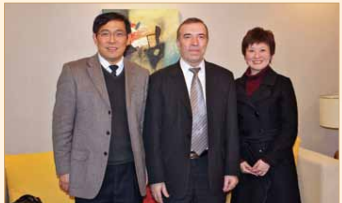
Захистивши дисертацію на кафедрі будівництва та експлуатації автомобільних доріг ХНАДУ, професор Ша Аймін сьогодні є професором технічного університету м. Сіань (Китай)