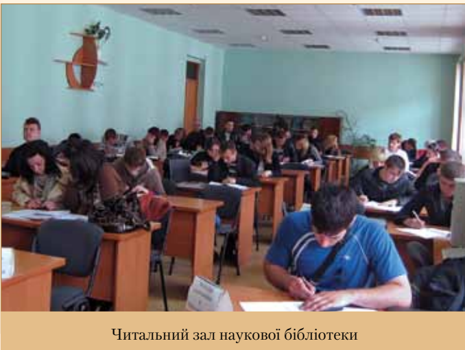
Читальний зал наукової бібліотеки

Головне стратегічне завдання НБ ХНАДУ – реалізація нової моделі бібліотеки, яка поряд із традиційними функціями якісного забезпечення літературою, інформацією науково-дослідницького та навчального процесів виконує роль інформаційно-інтелектуального центру та надає доступ як до власних, так і до світових інформаційних ресурсів.