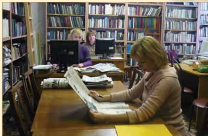
Користувачі наукової бібліотеки в інформаційно-довідковому відділі

Активну участь у таких заходах, як «Новорічні традиції та обряди України», День Святого Валентина, День