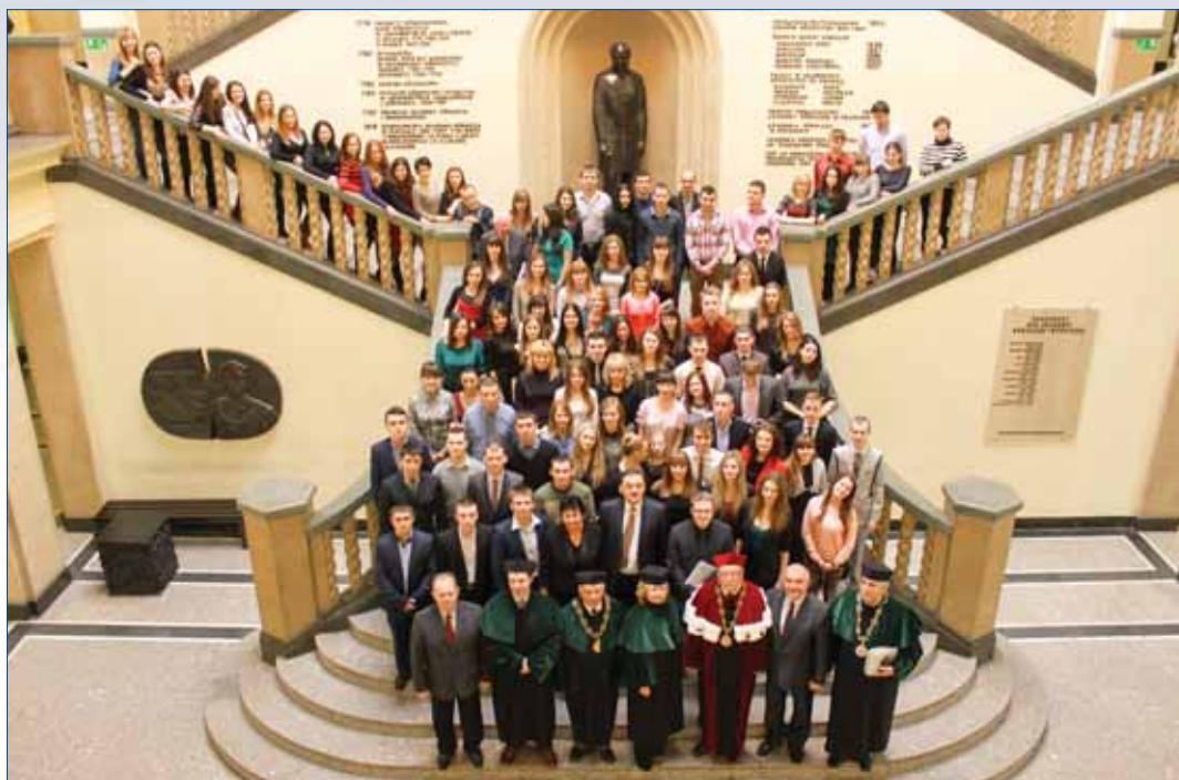
Студенти ІФНТУНГ та керівники інститутів і факультетів, які співпрацюють за навчальною програмою отримання двох дипломів на фоні пам'ятника Станіслава Стайціца у головному корпусі Краківської гірничо-металургійної академії ім. С. Стайціца (м. Краків, Польща)