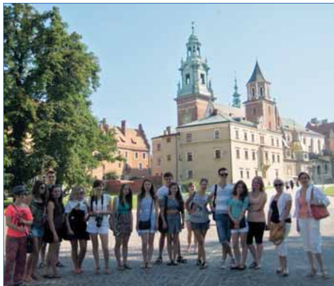
Екскурсія українських і польських студентів-архітекторів середмістям Кракова