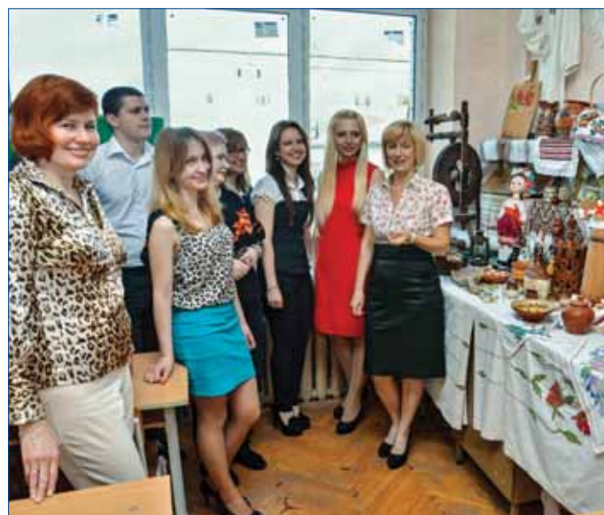
В етнографічній лабораторії кафедри

Концепція розвитку кафедри передбачає розширення й поглиблення наукових досліджень співробітниками кафедри щодо сталого розвитку туризму у Карпатському регіоні із залученням магістрантів й аспірантів; підготовку навчальних посібників з професійно-орієнтованих дисциплін; підвищення якості навчального процесу на стаціонарній та заочній формах навчання на всіх ОКР спеціальності «Туризм».