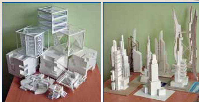
Роботи студентів з архітектурної композиції

Із 2009 р. налагоджена тісна співпраця кафедри з Інститутом архітектури Краківської політехніки та Вроцлавської політехніки, що дає можливість регулярно студентам та викладачам обмінюватися науково-проектним досвідом, брати участь у спільних творчих проектах, навчальних екскурсіях. Викладачі кафедри мають змогу проходити стажування у цих навчальних закладах та регулярно залучаються до участі в міжнародних конференціях та конгресах.