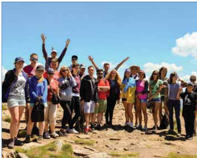
Сходження українських і польських студентів на Говерлу, липень 2016 р.