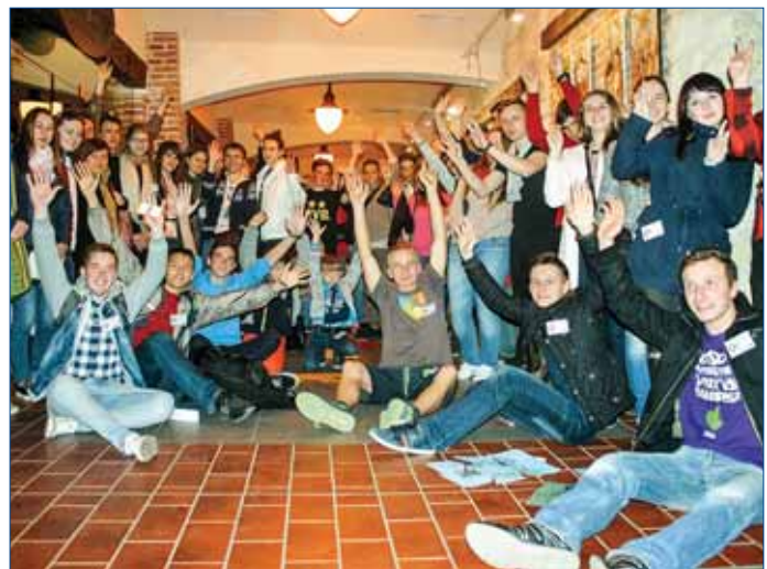
Архівест «Станіславівська фортеця», 2015 р.

Для студентів упродовж року організуються подорожі історичними місцями країни. Також вони мають можливість протягом III–IV курсів на контрактних умовах, паралельно з основним навчальним процесом, навчатися на кафедрі військової підготовки ІФНТУНГ, вступ на яку здійснюється за бажанням студента та за відповідним станом здоров'я, фізичної і психологічної підготовки, а також за рівнем успішності.