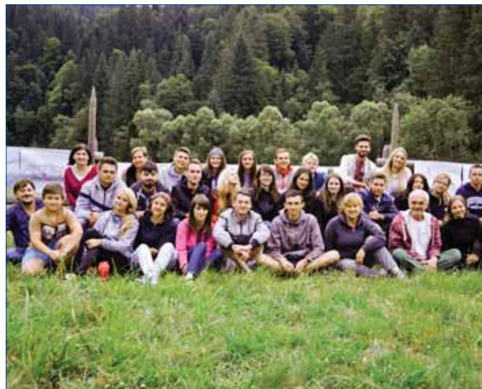
Польсько-українська інвентаризаційна практика, сmt Ворохта, липень 2016 р.