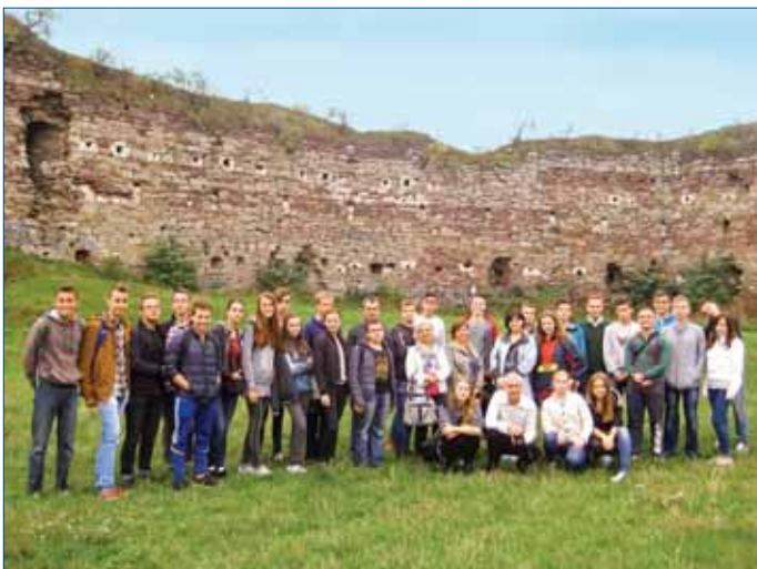
Навчальна екскурсія замками Західної України