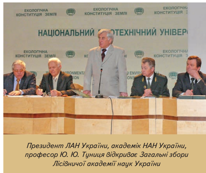
Президент ЛАН України, академік НАН України, професор Ю. Ю. Туниця відкриває Загальні збори Лісівничої академії наук України

ЛАН України є науково-творчим, методичним та координаційним громадським центром у галузі лісівництва, лісоексплуатації, технології деревообробки та економіки лісового комплексу. Вона діє на принципах демократич-