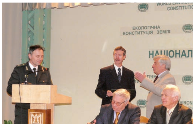
Президент ЛАН України, академік НАН України, професор Ю. Ю. Туниця вручає диплом Іноземного члена ЛАН України професору Дрезденського університету, доктору наук Н. Веберу

У структурі ЛАН України функціонує чотири територіальні відділення —