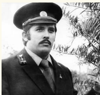
Лісничий Свірзького лісництва Бібрського держлісгоспу, 1977 р.