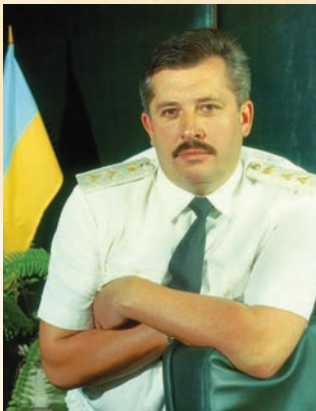
Генеральний директор ДЛГО «Львівліс», 1996 р.

лісогосподарського комплексу» (1995), «Історія лісництва України» (1995, у співавторстві), «Лісовими стежками Львівщини» (1995, у співавторстві), «Економіка комплексного використання і відтворення харчових ресурсів лісу» (1996, у співавторстві), «Лікарські, медоносні та корисні рослини Галичини» (1998, у співавторстві), «Першопостаті української лісівничої практики і освіти. Проблеми лісівничої освіти» (1999, у співавторстві), «Карпатські ліси: проблеми екологічної безпеки та сталого розвитку гірського регіону» (2002), «Критерії та індикатори сталого розвитку лісової галузі України» (2003).