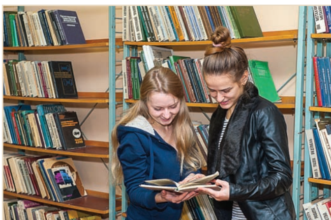
Навчальний читальний зал