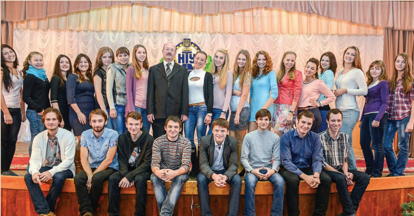
Клуб веселих і кмітливих Національного транспортного університету

ми в жанрі вокалу для участі в районних та міських конкурсах.