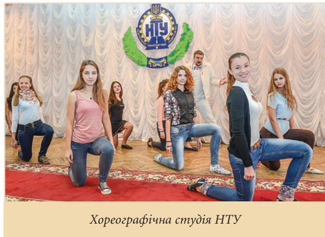
Хореографічна студія НТУ

Центр студентської творчості та дозвілля Національного транспортного університету, в народі ЦСТД, — це дивовижний світ, зазирнути до якого та навіть стати його частиною зможе кожен студент НТУ, який цього забажає.