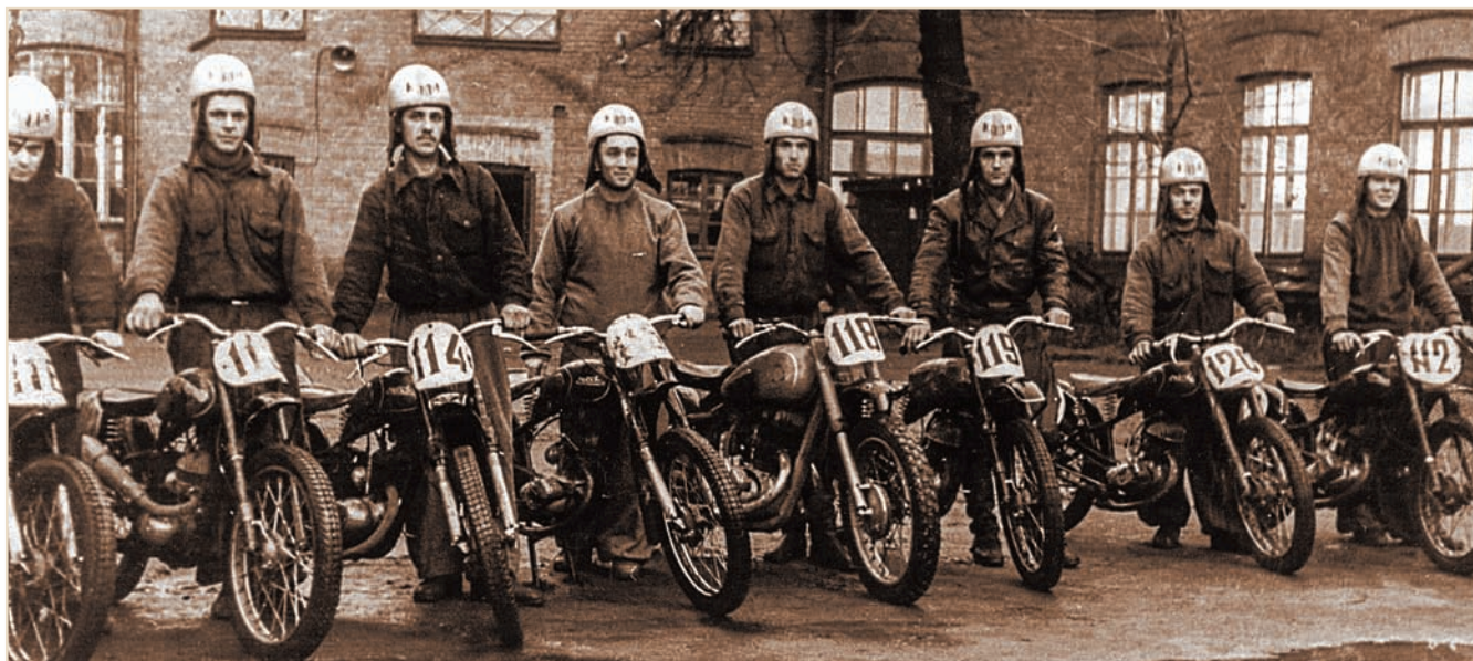
Мотокоманда КАДІ, 1955 р.

Ці змагання мали величезну популярність серед мотоспортсменів СРСР, мотокоманди з усієї країни (включаючи Москву, Омськ, Хабаровськ, Красноярськ, Владивосток, Мурманськ, Ташкент, Вільнюс, Ригу) брали участь у мотокросі. Число команд доходило до 30, кожна команда складалася із восьми спортсменів. Студенти КАДІ 26 разів були переможцями цих змагань.