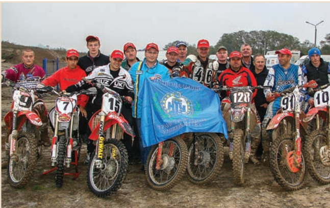
Мотокоманда Національного транспортного університету. Фінал Кубка України, м. Київ, 2013 р., мототраса «Пирогово»