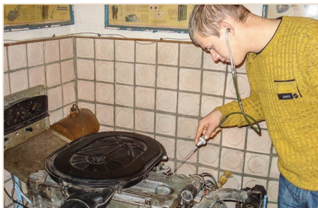
У лабораторії діагностики

університету спрямований у день майбутній і надалі робитиме все, аби забезпечити зростання якості підготовки фахівців і все більше відповідати вимогам суспільства, яке переходить до економіки знань.