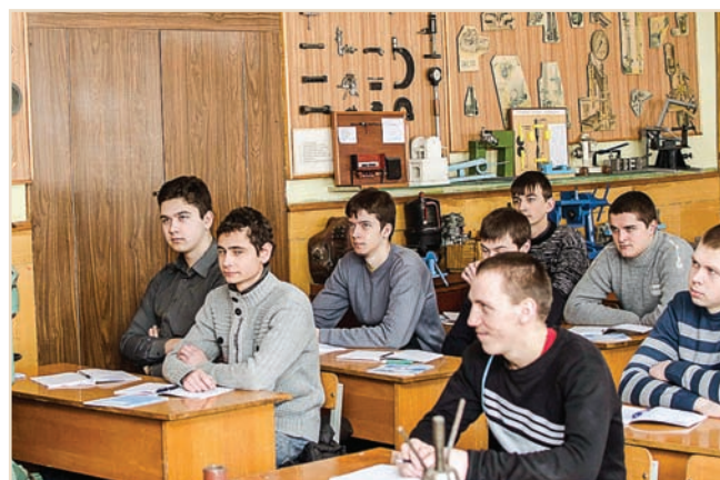
Заняття в аудиторії ремонту

Останнім часом зміцнена комп'ютерна база навчального процесу — створено п'ять комп'ютерних лабораторій, підключених до мережі Інтернет. Загальна кількість комп'ютерів у коледжі складає понад 180 одиниць. До послуг студентів та викладачів бібліотека з