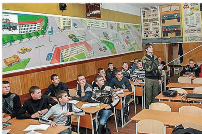
На заняттях із безпеки дорожнього руху

Колектив Житомирського автомобільно-дорожнього коледжу Національного транспортного