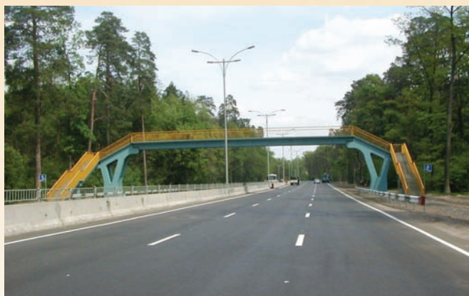
Велика кільцева дорога

З 2002 до 2003 р. він обіймав посаду першого голови правління ВАТ «Державна акціонерна компанія «Автомобільні дороги України». Під його керівництвом