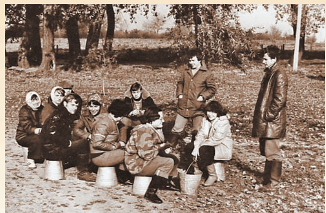
Студенти групи Е-V-2 на збиранні овочів у с. Красилівка Броварського району. Жовтень 1979 р.