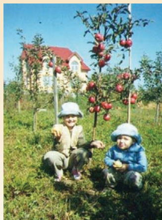
Сад і онуки. «З вірою в щасливе майбутнє»

Віктор Притула підтримував своїх близьких, друзів, колег та підлеглих: духовно багата людина, він щедро ділився усім, що мав. Як же пощастило тим, хто був із ним знайомий і на чиему житті назавжди збережеться слід його присутності!