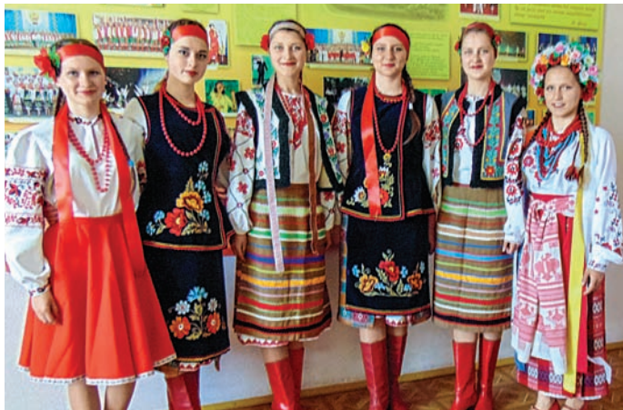
Вокальний ансамбль «Калинонька», 2017 р.

У коледжі функціонують спортивні секції (з легкої атлетики, футболу, волейболу, шахів, настільного тенісу, легкоатлетичної гімнастики), гуртки технічної і художньої самодіяльності.