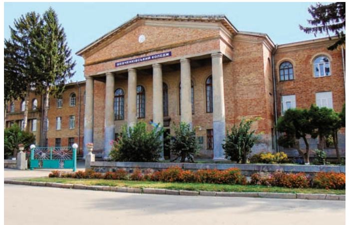
Навчальний корпус Шевченківського коледжу Уманського НУС