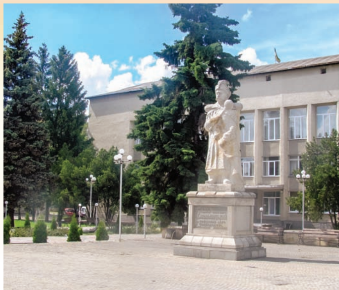
Пам'ятник Богдану Хмельницькому, м. Ямпіль, Вінницька область