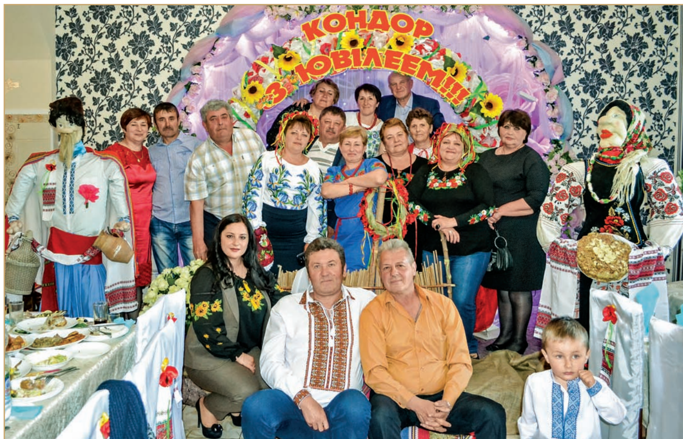
Колектив ФГ «Кондор».