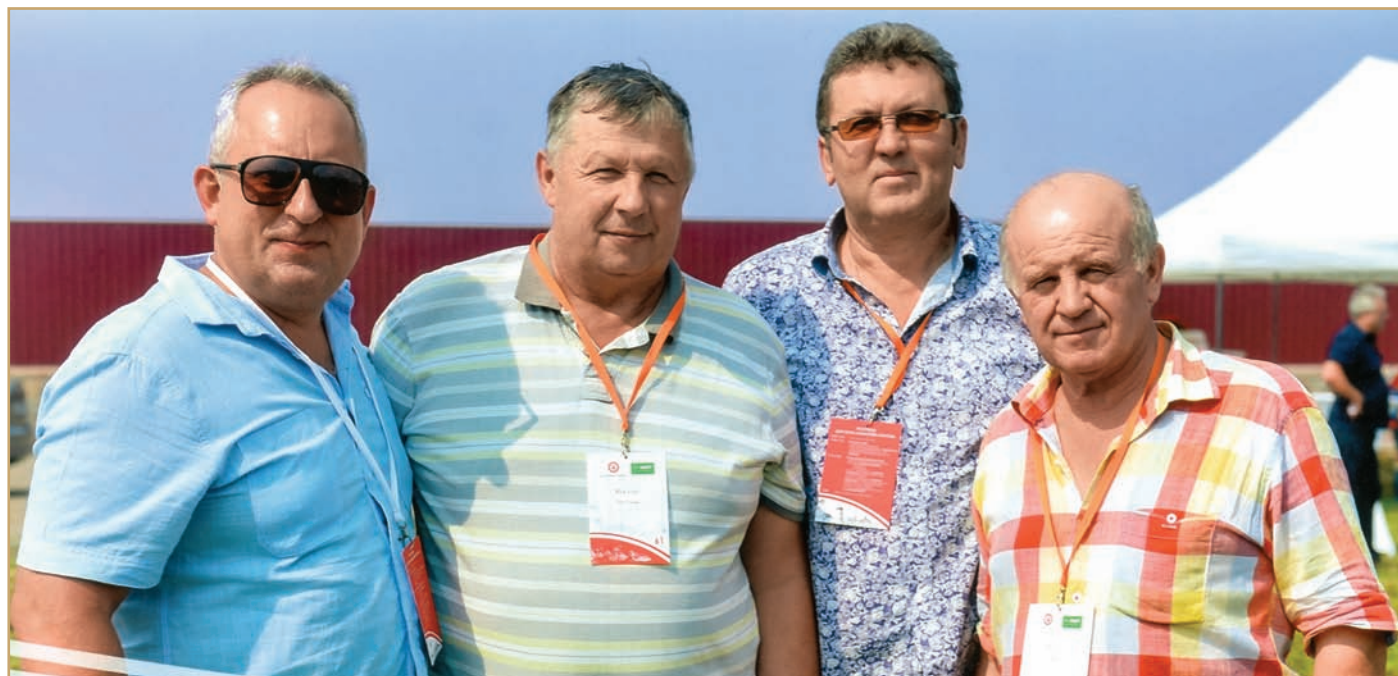
День поля, 2015 р.