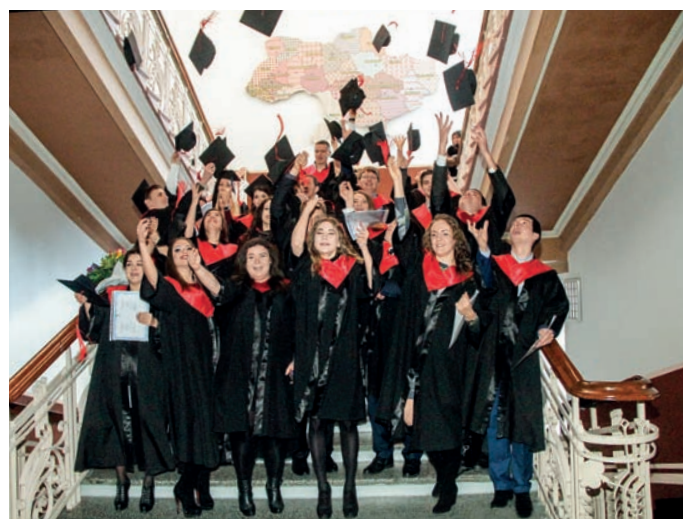
Випуск магістрів юридичного факультету, 2017 р.

Факультет є організатором та співорганізатором міжнародних, всеукраїнських та регіональних науково-практичних заходів (Щорічної Міжнародної науково-практичної конференції «Запорізькі правові читання», Щорічного Всеукраїнського форуму вчених-адміністративістів, Міжнародної науково-практичної конференції «Адаптація адміністративного законодавства України до Права ЄС», Щорічної всеукраїнської наукової