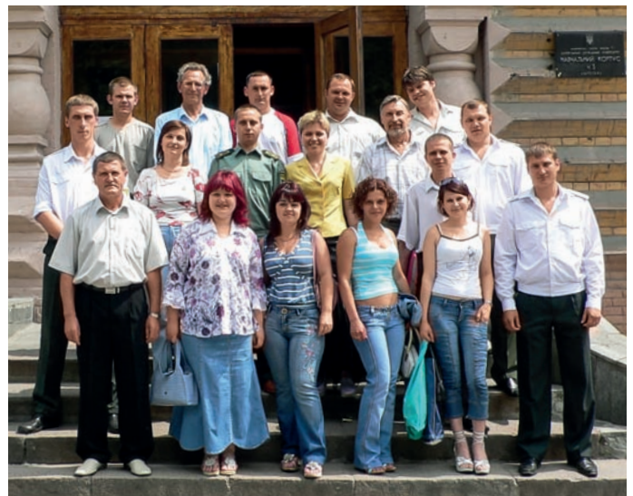
Група мисливствознавців разом із викладачами після складання державного іспиту з метою здобуття ОКР «спеціаліст»

Життєве кредо: «Намагайся ставитися до людей так, як бажаєш, щоб ставилися до тебе». Улюблений вислів: «Голову маєш не для того, щоб шапку носити».