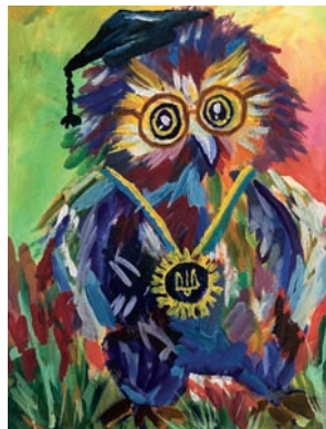
Подарунок для мамі

Життєве кредо: «Можливо все, неможливе просто потребує більше часу» (Ден Браун).