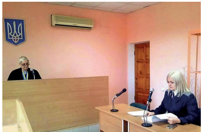
Судове засідання у кримінальному провадженні, Шевченківський районний суд м. Запоріжжя

Життєве кредо: «Успіху досягають не ті, в кого ніколи не виникає проблем, а ті, кого ніщо не може зупинити, коли вони йдуть вперед» (Бен Карсон).